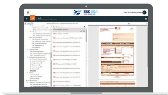
Aperçu sur écran PC ou tablette